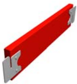
plinthe de bout