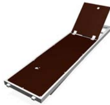
plateau à trappe